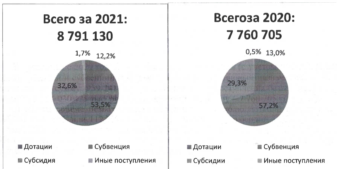
Диаграмма № 2

Согласно Приложению №4 к пояснительной записке отчета об исполнении бюджета за 2021 год «Информация об использовании средств вышестоящих бюджетов, полученных в 2021 году, и остатков средств вышестоящих бюджетов прошлых лет, утвержденных в бюджете городского округа Тольятти, на 01.01.2022 года» фактическое использование средств субсидий – 2 863 579 тыс. руб. или 100% от поступивших; субвенций – 4 690 829 тыс. руб. или 99,5% от поступивших; иным межбюджетным трансфертам – 146 786 тыс. руб. или 98,6% от поступивших.