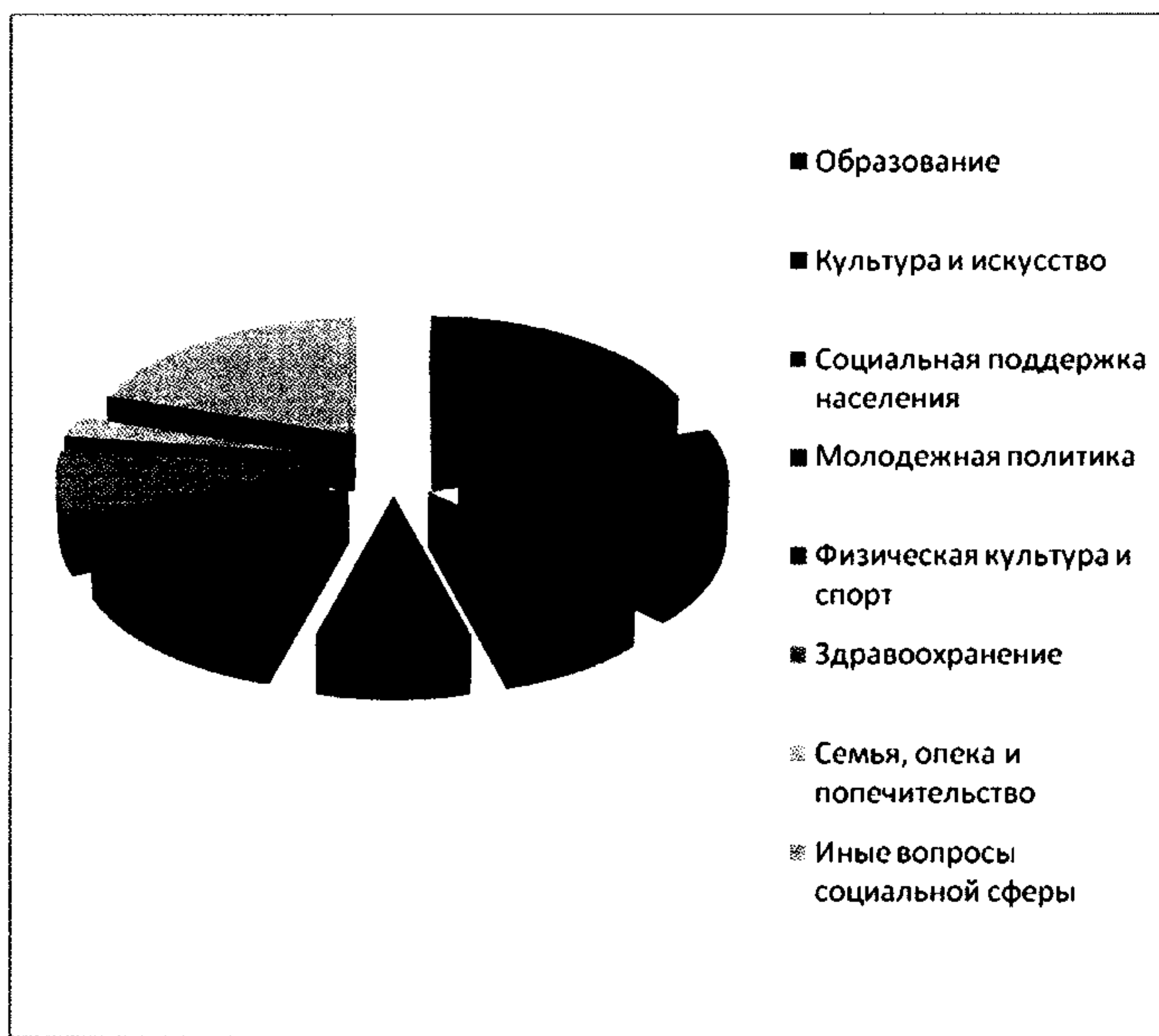
Диаграмма №2. Распределение вопросов – VI созыв