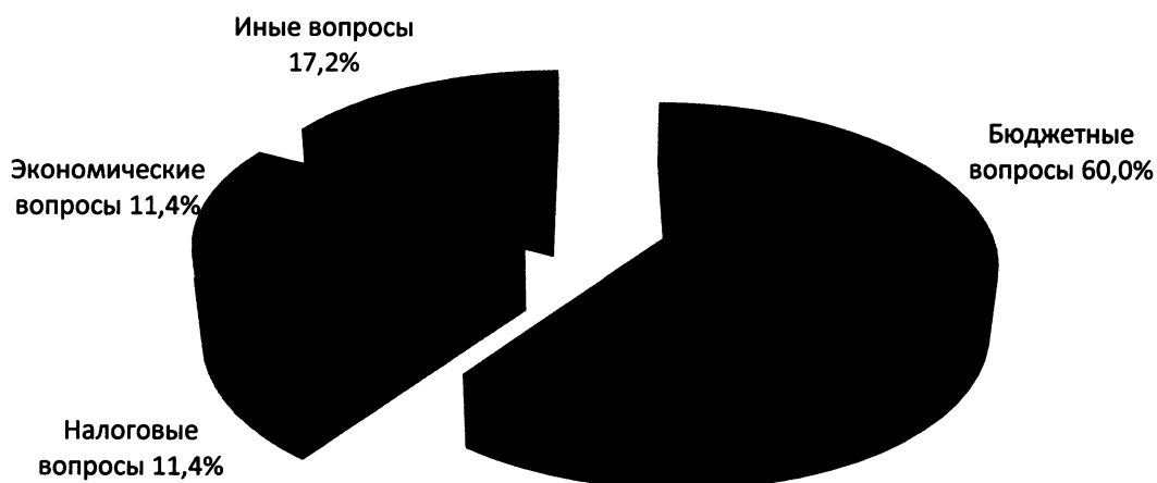
Диаграмма 2 (VII созыв)

Из наиболее значимых вопросов, находящихся на контроле комиссии, можно отметить следующие: