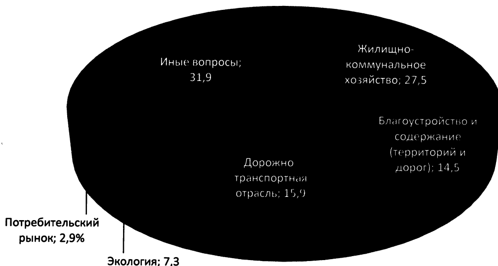
Диаграмма 1 (VI созыв)