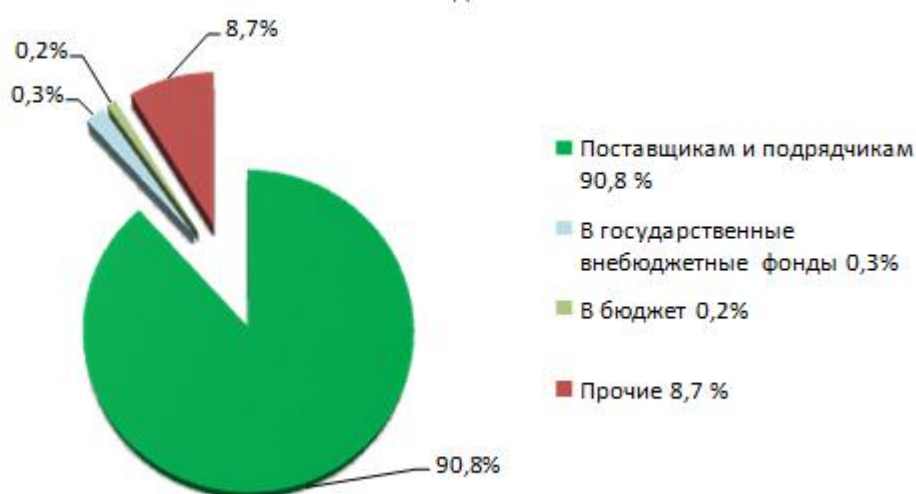
Структура просроченной кредиторской задолженности на 01.01.2014 года

Дебиторская задолженность крупных и средних предприятий г. Тольятти на 1 января 2014 года составила 73,0 млрд. рублей, из нее просроченная – 1,6 млрд. рублей, или 2,2 процента [2].